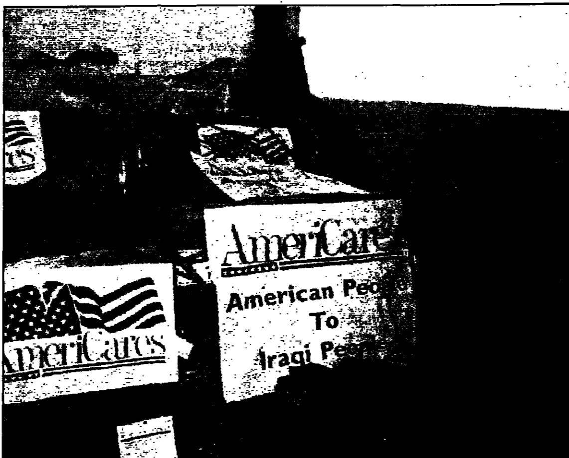
متطوعة امريكية الى جانب المساعدات التي يقدمها الى بغداد امس

على سفير للشروع الأمريكي قائلا ان مجلس الامن سيستخدم في اعقاب التقرير نصف السنوي الذي سيصدره في تشرين الثاني (نوفمبر) القادم... (The text discusses the US ambassador's role in the UN and the ongoing negotiations regarding Iraq's nuclear program.)